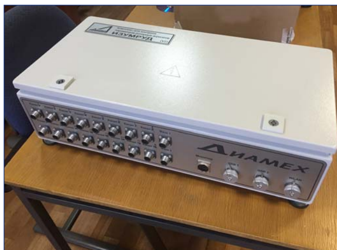
16-канальный измерительный блок ИЗУМРУД

Для более простых задач, где требуются синхронные измерения выпускается 8-канальный блок ИЗУМРУД, в котором накопление и обработка данных осуществляются в подключаемом персональном компьютере с предустановленным ПО.