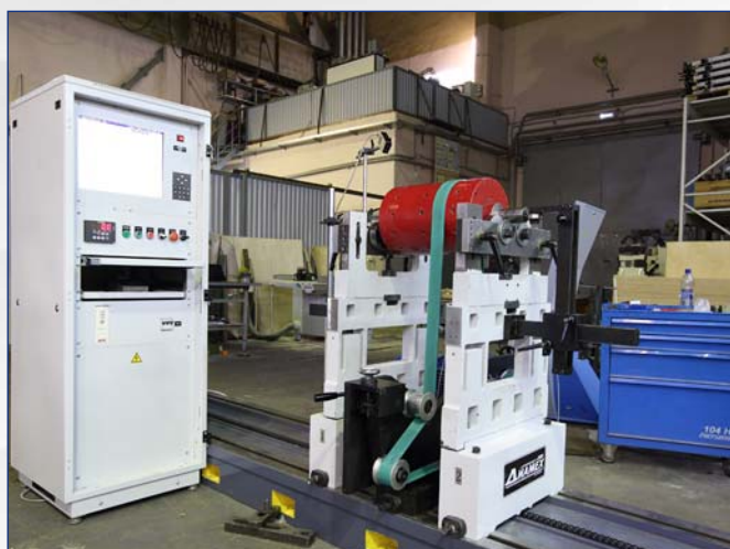
Дорезонансный балансировочный станок, изготовленный совместно с компанией Атис-Баланс