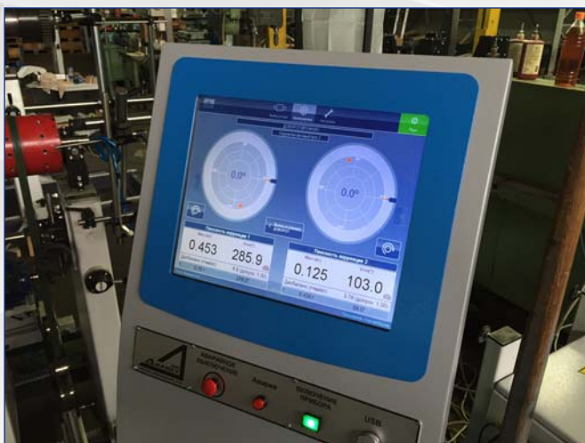
Внесен в Госреестр средств измерений RU.C.28.004.A No 57700

С середины 2015 года ДИАМЕХ оснащает все балансировочные станки новой измерительной системой САПФИР-3, которая также доступна в версии для модернизации балансировочных станков других производителей. Уникальные точностные характеристики, новый удобный пользовательский интерфейс и большое количество новых функций несомненно будут высоко оценены специалистами.