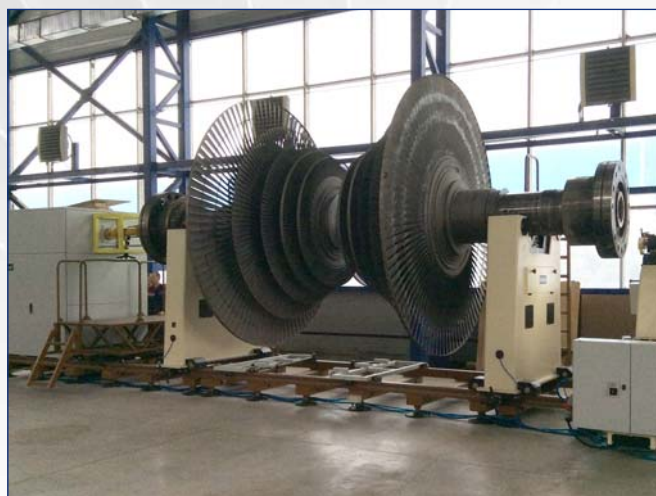
Балансировочный станок ВМ-36000 введен в эксплуатацию в октябре 2015 года на Экибастузской ГРЭС-1

Совместно с компанией АТИС-БАЛАНС был реализован значимый проект по изготовлению и поставке дорезонансного (жесткого) балансировочного станка грузоподъемностью 2 тонны для роторов авиационных газотурбинных двигателей, что позволит в дальнейшем отечественным предприятиям авиационного двигателестроения полностью отказаться от приобретения дорогостоящих аналогов зарубежного производства.