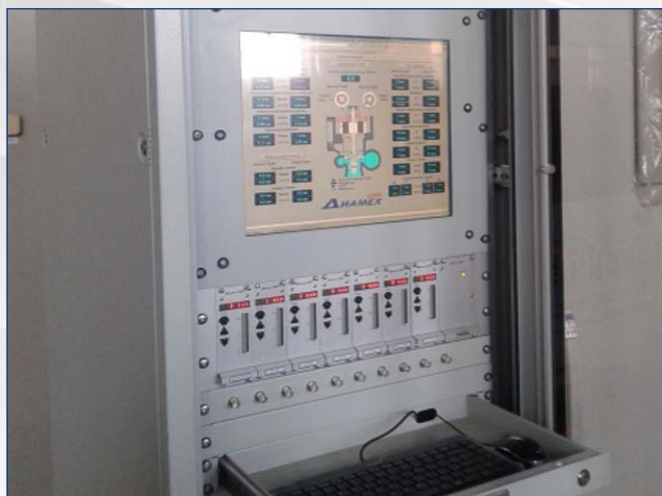
Стойка с системой АЛМАЗ-7010-ГЭС на гидроагрегате № 4 Зеленчукской ГЭС

В настоящее время ДИАМЕХ совместно с АО "Институт Гидропроект" ведет разработку проекта модернизации и расширения комплекса виброконтроля АЛМАЗ-7010-ГЭС установленного на гидроагрегатах №№ 1...6 Загорской ГАЭС, входящей в состав ПАО "РусГидро".